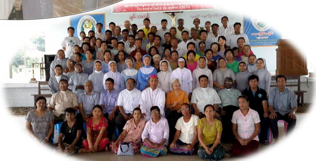
AsIPa Workshop ...စာ(၁၇)