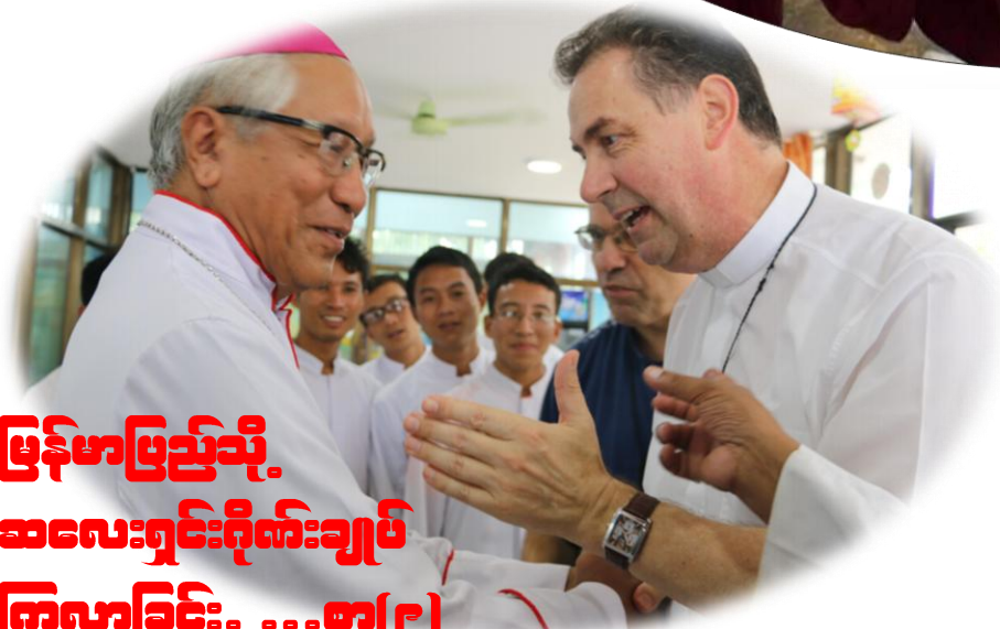
ဖြန့်ဖြူးချိမ်းမိမှု၊ ဆေးရုံစီမံခန့်ခွဲမှု ကြွေးမြီ... ..စာ(၉)