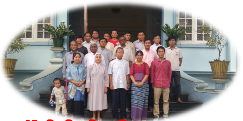
JP နှစ်ပတ်လည်အစည်းအဝေး...စာ(၁၃)

ကမ္ဘာအရပ်ရပ်သို့ သွားကြရုံမက ဝေဖန်တောင်းဆိုမှုများကို ဟောပြောကြလော့။