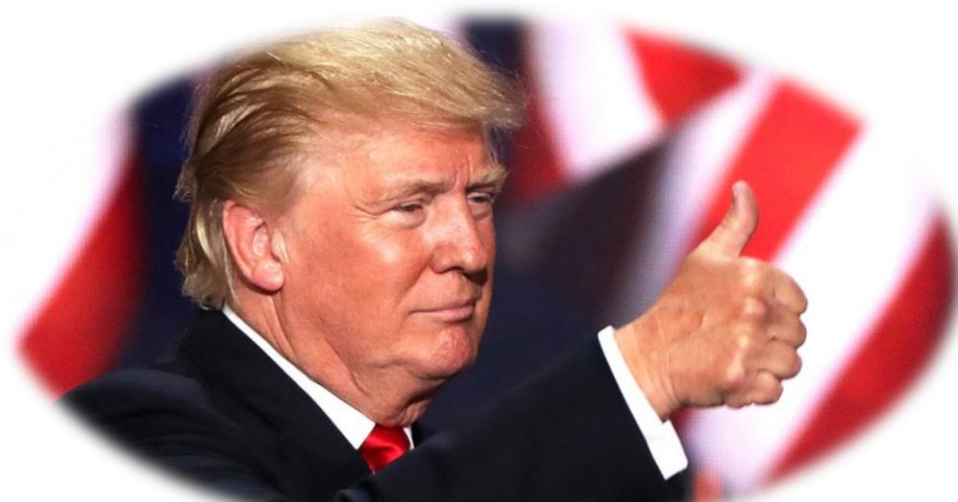
အမေရိကန် သမ္မတသစ် ထရမ်...စာ (၂)